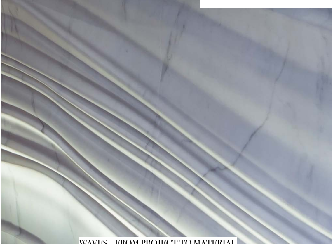
WAVES...FROM PROJECT TO MATERIAL